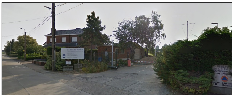
Rue Vincent Bonnechère, 30 – 4367 CRISNEE